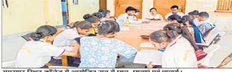
गुगरापुर स्थित कॉलेज में आयोजित सत्र में छात्र-छात्राएँ एवं प्राचार्य।