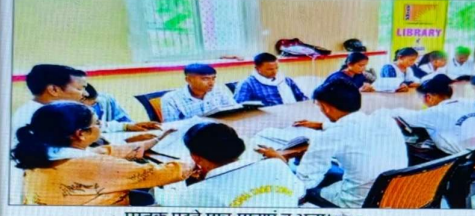
पुस्तक पढ़ने छात्र-छात्राएँ व अन्य। संवाद

गुगरापुर। एक पुस्तक पढ़ें अभियान के तहत पठन एवं परिचर्चा का आयोजन किया गया। विद्यार्थियों ने अपनी रुचि के अनुसार पुस्तकों का चयन कर उनका अध्ययन किया और विभिन्न विषयों पर विचार साझा किए।